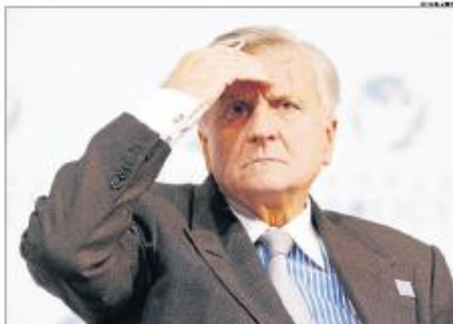
El vicepresidente del Gobierno, Pedro Solbes, se cubre los ojos ante el sol tras una reunión con los líderes de los bancos centrales de Europa.

La rebaja del precio del dinero en la zona euro entrará en vigor a partir de la próxima operación principal de refinanciación del 15 de octubre.