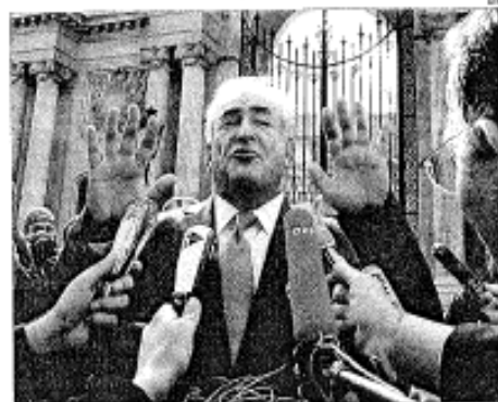
El director gerente del FMI, Dominique Strauss-Kahn